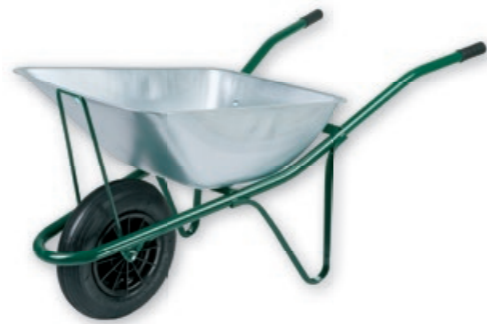
6-924 B / 6-924 C