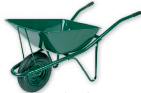
6-924 / 6-924 A

Frame of the wheelbarrow is fully welded, it can be lacquered or zined. Tray is bolted. Suitable for construction and agricultural works. Wheelbarrows are perfectly packed, for high effective loading capacity and warehouse.